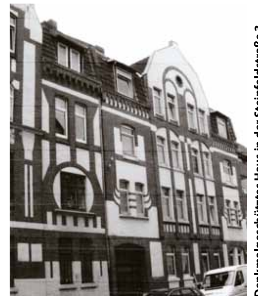
Denkmalgeschütztes Haus in der Steinfeldstraße 3

Sonderführungen auf Anfrage im Gemeindebüro, Tel. 2 10 42 84, oder direkt bei Rudolf Lotze unter 21 17 54. RUDOLF LOTZE