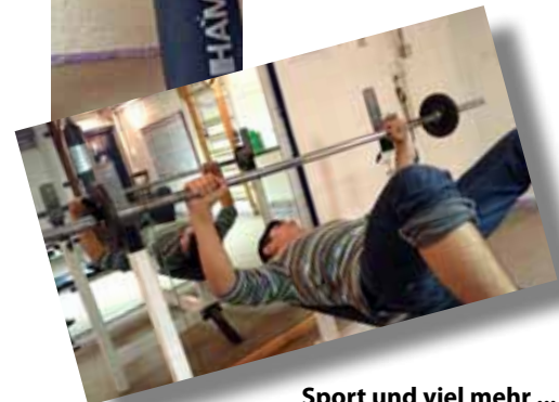
Sport und viel mehr ...