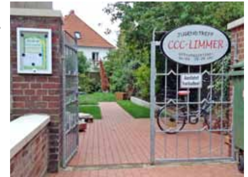
Der Jugendkeller ist montags bis donnerstags geöffnet.

CCC Ansprechpartnerinnen für ihre Bedürfnisse und Sorgen, aber auch ganz konkrete Hilfe, zum Beispiel für Hausaufgaben oder den Kontakt mit den deutschen Ämtern und Behörden.